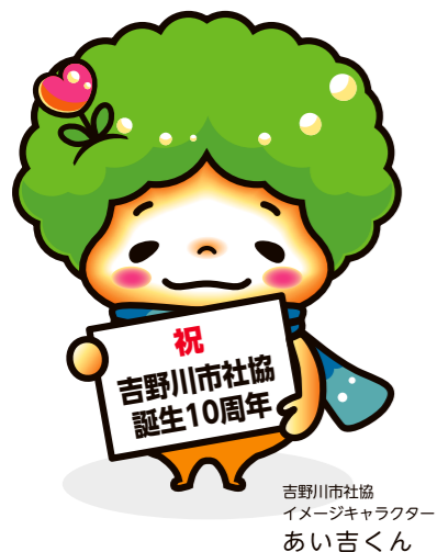
吉野川市社協 イメージキャラクター あい吉くん