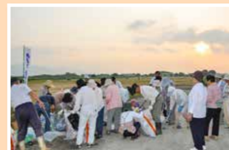
花火大会翌日、早朝5時30分から会場のごみ拾い

私たちと一緒に、自分のできることから気軽に、活動してみませんか。きっと今までと違う世界が発見できると思います。皆さんの参加を心よりお待ちしております。