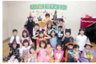
ハロウィンパーティ

健全な遊びや体験活動をととして、子どもたちの健やかな育成を図ることを目的に、吉野川市より指定を受けて児童館の管理運営を行います。