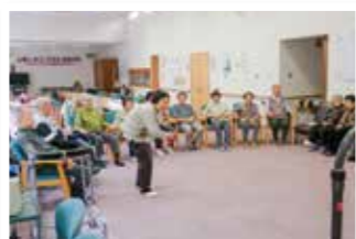
美郷デイサービスセンター