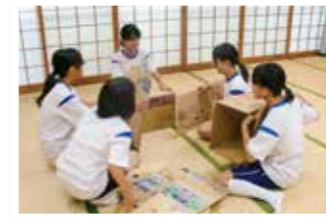
サマーチャレンジボランティアワーク 災害時対応段ボールトレ作り