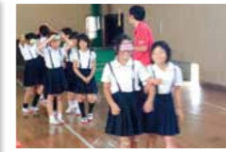
福祉教育 アイマスク体験