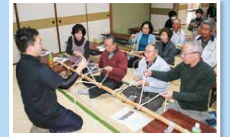
ロープワークを熱心に習う