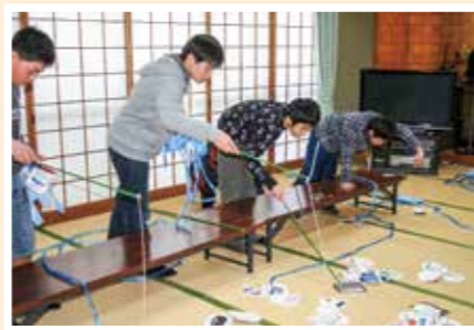
避難ゲームに挑戦!!