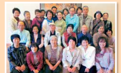
活動30周年記念会(テープ利用者とともに)

近年、情報の提供方法もテープからCDに移行しつつあり、新しい技術の習得に日々励んでいます。阿波の民話の点字本、個人的な音訳や点訳等のご要望があれば、ご連絡ください。