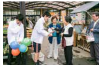
街頭募金の様子(毎年10月の第1土曜日に実施)