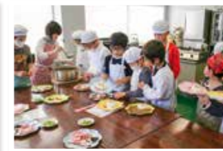
デコレーションカレー作り